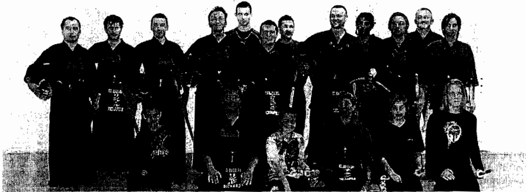
Il est toujours possible de rejoindre la section kendo.

La section kendo du Judo-club nazairien a repris ses activités au début du mois de septembre. Les effectifs sont en légère hausse par rapport à la saison dernière « Nous souhaitons également confirmer nos bons résultats de l'an passé » annoncent les responsables. L'an passé, la section avait décroché une participation pour la phase finale du championnat de France