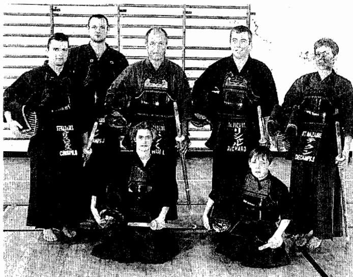
Une partie de l'effectif lors du dernier entraînement de la saison.