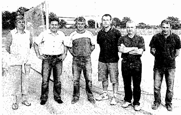
Les dirigeants comme les joueurs vont quitter le stade des Rochelles sans regret.